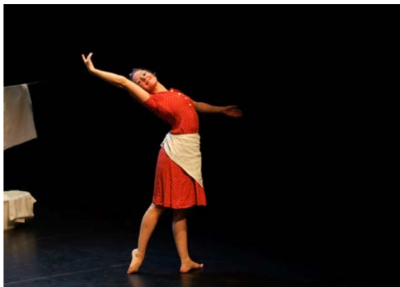
'Dat was Dat'