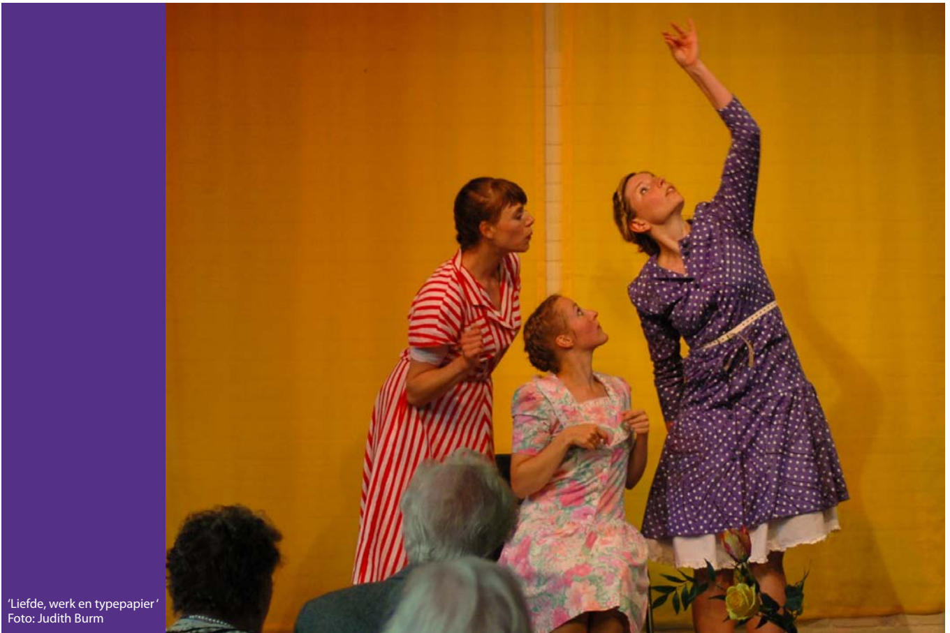
'Liefde, werk en typepapier'